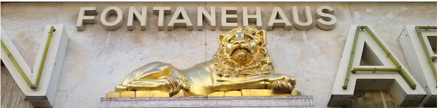
Detail an der Löwen-Apotheke