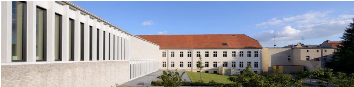
Museum Neuruppin