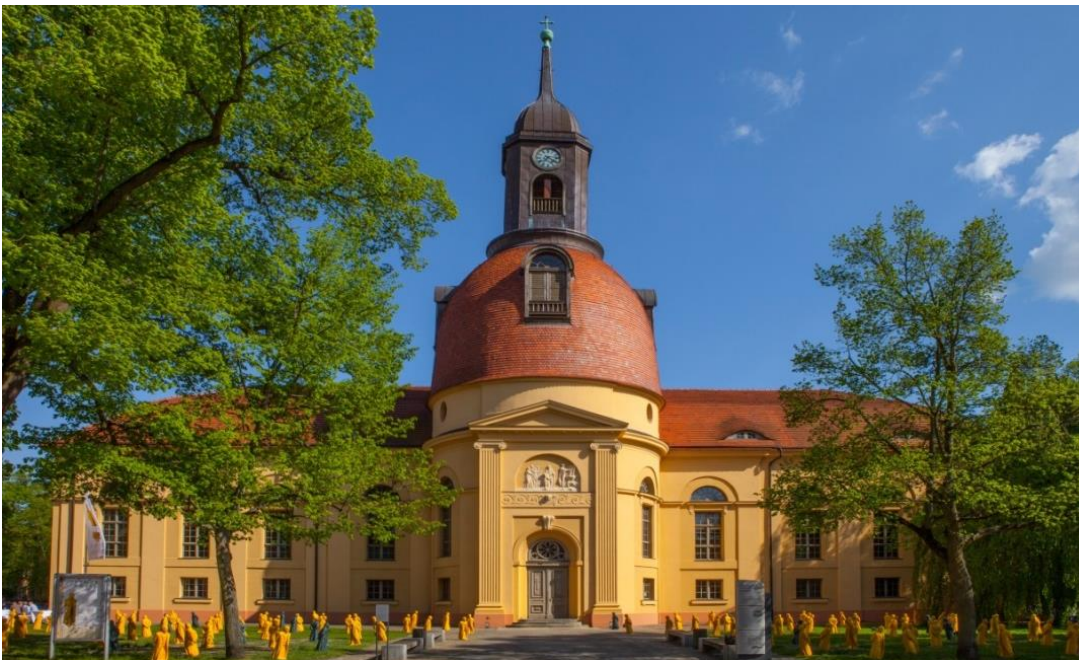
Fontane-Figuren vor der Kulturkirche