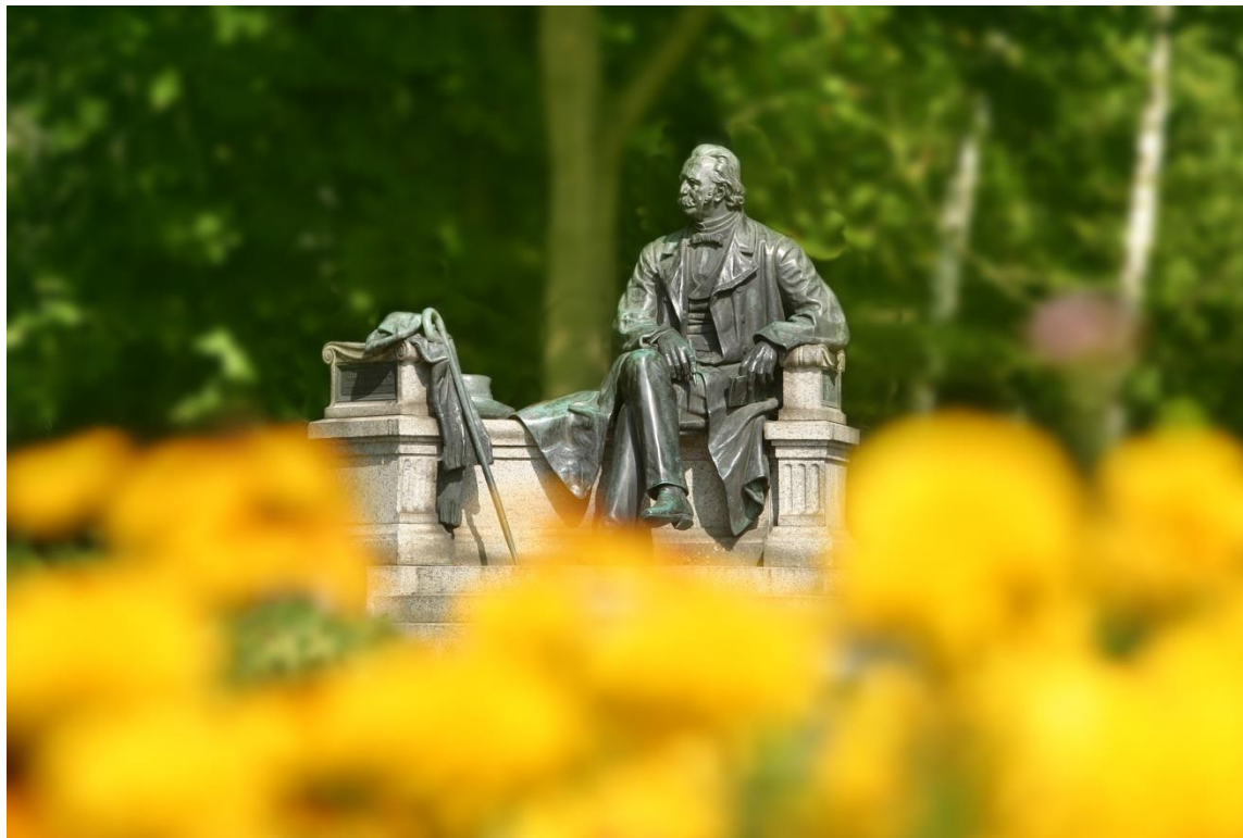
Fontane-Denkmal © Traub