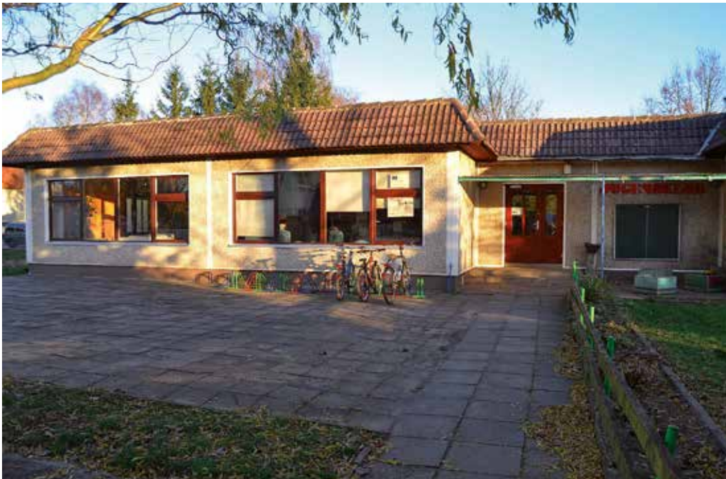
JC60, Wittstock JC60, Wittstock