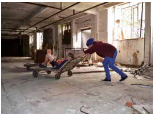
Energie sparen Teil 2 Att spara energi 2