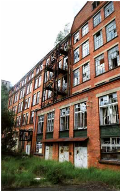
Natur erobert Industrie Naturen erövrar industrin